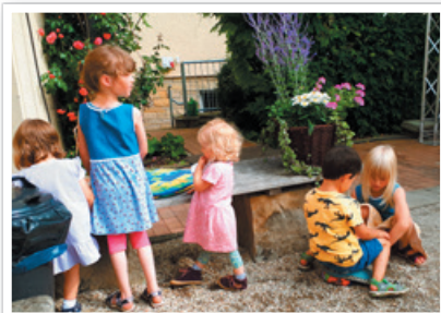
Wie gut, dass es Kies auf dem Kirchplatz gibt...