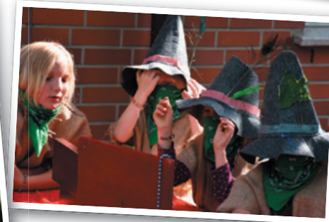
Die Räuber bewundern ihre Beute.