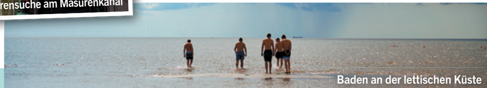
Baden an der lettischen Küste