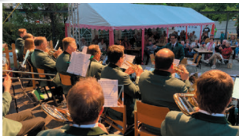
Die Bückeburger Jäger geben ihr Benefiz-Konzert Open-Air

Musik, Kultur, Kino, Spirituelles, Kreatives, Kulinarisches – alles das war bis zum 8. August auf unserem Kirchplatz zu erleben.