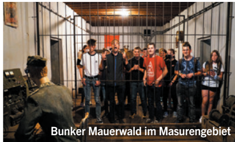
Bunker Mauerwald im Masurengbiet