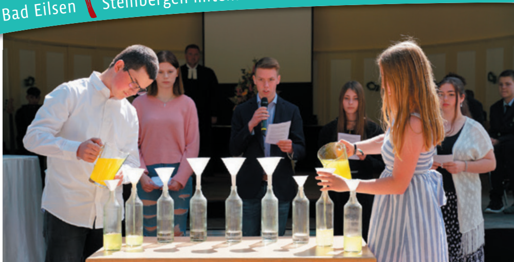
Konfirmationen 2021 in Steinbergen und Bad Eilsen