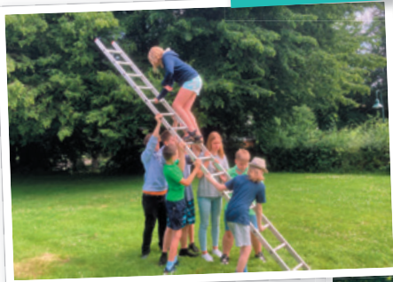
...auf der Himmelsleiter.