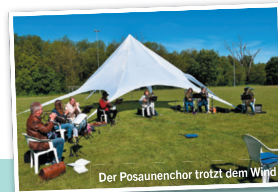
Der Posaunenchor trotz dem Wind