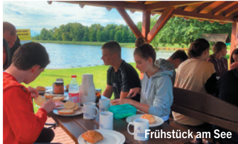
Frühstück am See