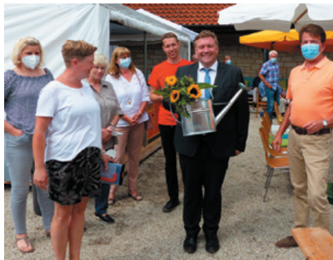
Viele Grußworte, Geschenke und das Segenslied "Geh' Du Deinen Weg getrost und ohne Sorgen" schlossen sich dem Gottesdienst an.