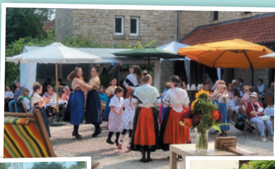
Café & Tachtentanz