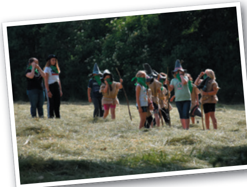
Auf, wir räubern jetzt.