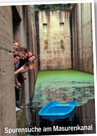
Spurensuche am Masurenkanal